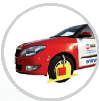
Blokady na koła samochodów