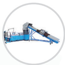
Linie do recyklingu