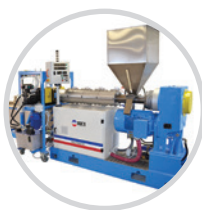
Linie do regranulacji