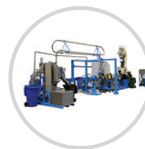
Linie do compoundingu