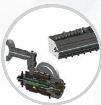
Projektowanie i produkcja narzędzi do głowic wytłaczarskich, dysz itd.