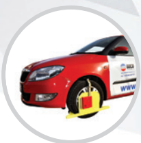
Sicherungskralen für Fahrzeuge