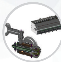
Konstruktion und Herstellung von Kunststoff-Extrusionswerkzeugen (Köpfe, Düsen usw.)