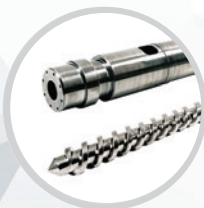
Schnecken und Zylinder